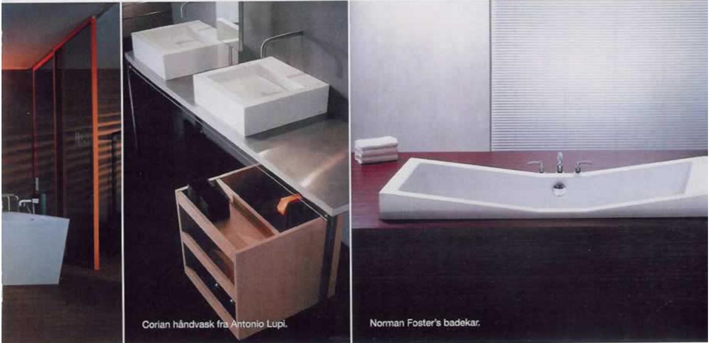
Corian håndvask fra Antonio Lupi.