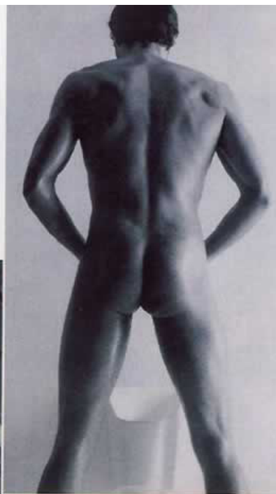
Badekar fra Duravit's Design-Plus vindserie Stark 3.