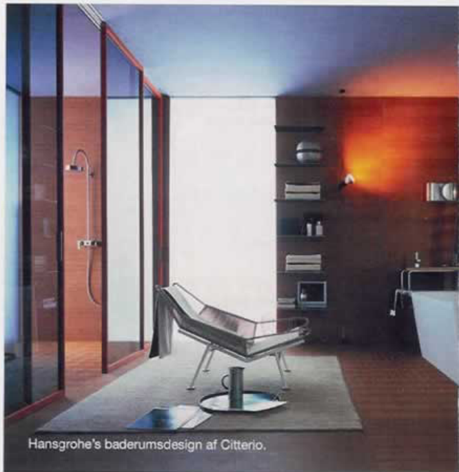
Hansgrohe's baderumsdesign af Citterio.